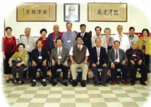
屏師三七級簡師科校友畢業57年返校參觀 04.11.19

這一天，本來認為只返母校看看，懷念往事的回憶，想不到不上班的星期六，母校還安排數位服務人員在民生校區大樓玄關，