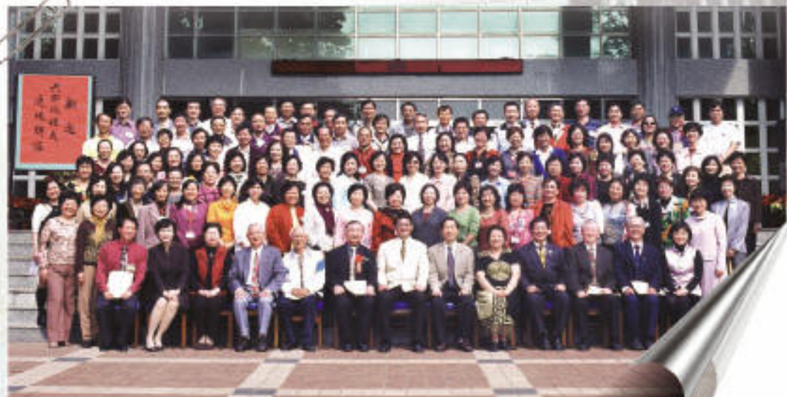
屏師 64 級畢業三十週年同學會合影留念 2005.12.11