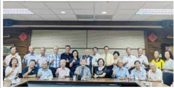
▲高雄市退休校長協會向永樂理事長率代表恭賀鄭英耀校長

鄭英耀校友，曾進修台灣彰化教育學院(今彰化師大)輔導系、國立高雄師範教育研究所碩士(今高雄師大)、國立政治大學教研所博士。其經歷廣泛：曾任國立中山大學校長八年、遠哲科學教育基金會董事長兼高雄辦公室規劃小組召集人、美國加州柏克萊分校教育研究所訪問學者、台灣教育研究學會(TERA)創會理事長、以及屏東師專畢業後曾經擔任小學教師。