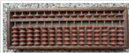
▲爸爸用的算盤 ▶算盤上爸爸親筆寫的名字